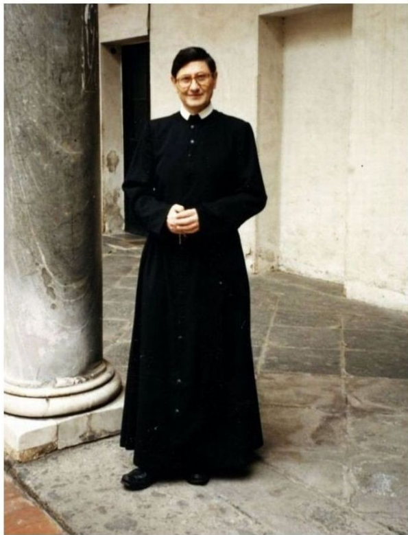
Nel chiostro maiolicato